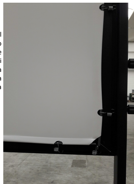
Dettaglio del retro dello schermo e del sistema di montaggio a molle della tela